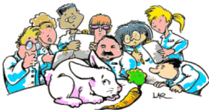
the Beta-carotene tester

* Mantieni le tue esperienze di playtesting piuttosto riservate. Va bene conferire con altre persone che stanno testando lo stesso gioco, ma una volta che esso sia stato rilasciato, non parlare ai giocatori dei bug trovati nelle versioni beta. Gli autori, naturalmente, non vogliono apparire inetti o stupidi verso il pubblico e discussioni indiscriminate di